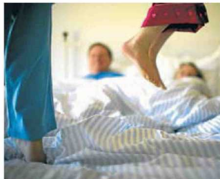
CANVIS. El salt de la infància a l'adolescència no és fàcil. Cal buscar recursos per afrontar-lo.

Els adolescents, com a persones en ple procés de maduració, també tenen deures i drets