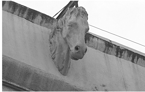
Cabeza de caballo en la fachada de un edificio del número 227 de la Rambla d'Ègara.

■ Visita www.diarideterassa.es y envíanos tus fotos, de tu familia, amigos, de ese viaje inolvidable de ese momento especial o la imagen que denuncia una situación incorrecta. No te olvides de añadir tus datos. Cada día seleccionaremos las mejores, las más divertidas, las más impactantes y las publicaremos en nuestra edición impresa, en esta misma sección. Participa también en nuestros concursos (más información en nuestra web).